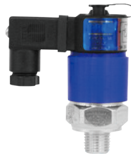
AT-JB (B) 16 x 16